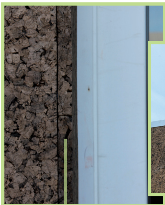
Retour fenêtre avec un liège de 2 cm