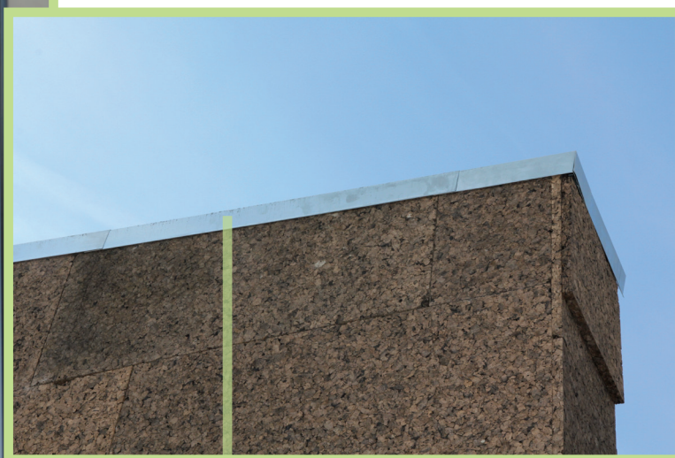
Couvre-chant en aluminium